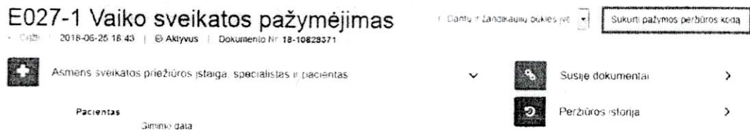
1 paveikslas. Sukurti pažymos peržiūros kodą